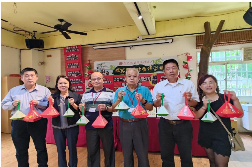
雲林榮服處端節活動會場合照

【記者張嘉麟 雲林報導】雲林縣榮民服務處於端午節前夕舉辦「端節粽香傳榮情活動」，邀請年長榮民(眷)至榮服處特約商店澄霖沉香味道森林館及雲林虎尾持法媽祖宮參觀。