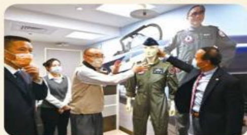
欣欣百貨設立「國軍服裝提領處」，是百貨界的一項創舉。