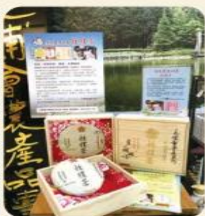
設立還輔會農產品專區，是欣欣百貨在疫