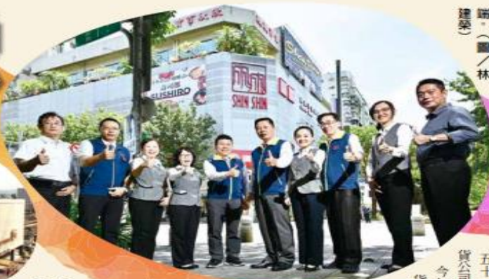
尤董事長（右五）帶領同仁與時俱進，讓欣欣百貨始終走在時代潮流前端。（圖／林建榮）

民國 61 年 6 月 28 日欣欣百貨開幕營業，至今已 51 年，是臺北現存歷史最悠久的百貨公司。（圖／欣欣百貨）